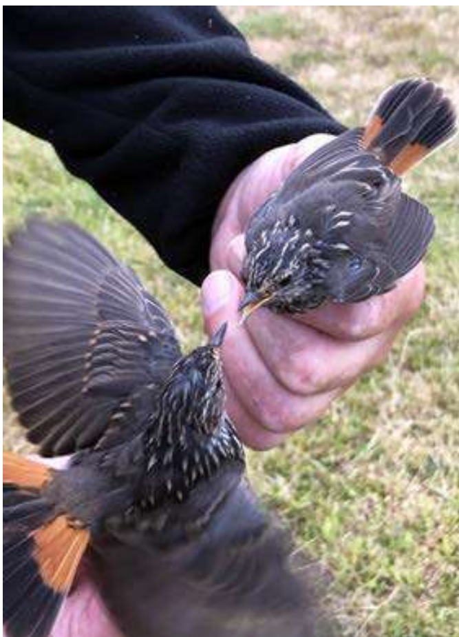
Sydlig blåhals, Tømmerby Fjord, 8. juli 2019.