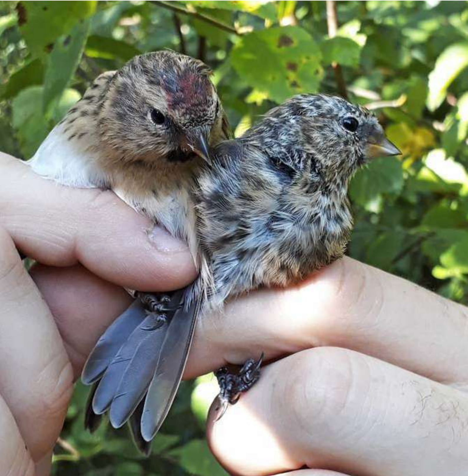
Gråsisken (han og 1K), Brabrand Sø, 25. august 2019.