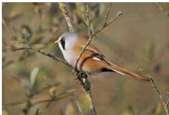
Skægmejse, Vejlerne, 29. september 2015.

Udviklingen i bestanden af adulte skægmejser ( Panurus biarmicus ) ved Brabrand Sø i perioden 2006-2015.