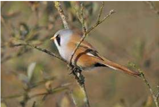
Skægmejse, Vejlerne, 29. september 2015.

Udviklingen i bestanden af adulte skægmejser ( Panurus biarmicus ) ved Brabrand Sø i perioden 2006-2015.