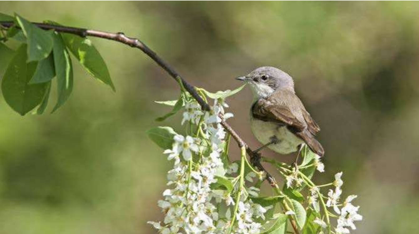
Gærdesanger, Sæby, 14. maj 2015.